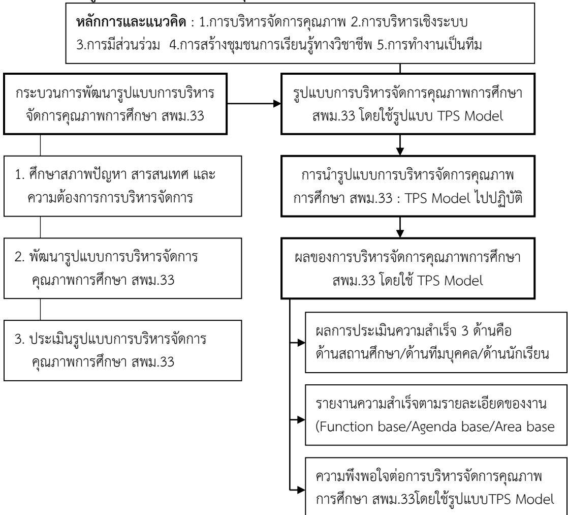
ภาพที่ 1 กรอบแนวคิดของรูปแบบการบริหารจัดการคุณภาพการศึกษา

กรอบแนวคิดของรูปแบบการบริหารจัดการคุณภาพการศึกษา ดังภาพประกอบ 1