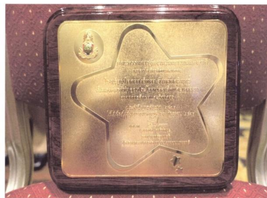
ภาพโล่รางวัลองค์กรที่ทำความคุณประโยชน์ต่อเด็กและเยาวชน ประจำปี ๒๕๖๑